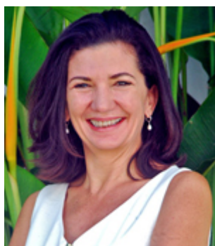
Autor Cristina Bolio

¿Quieres saber más tips como estos? Conecta con nosotros en Facebook y si aún no te has suscrito al Newsletter de Yucatán Properties, hazlo aquí y recibe en la comodidad de tu correo, consejos e información gratuita que te ayudarán a convertir rápidamente, tus ideas en una realidad.