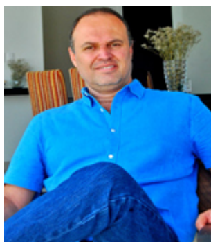
Autor Lic. Jorge Semerena

Conecta con nosotros en Facebook o suscríbete a nuestro newsletter , para más tips e información sobre las mejores propiedades que satisfagan tus necesidades actuales.